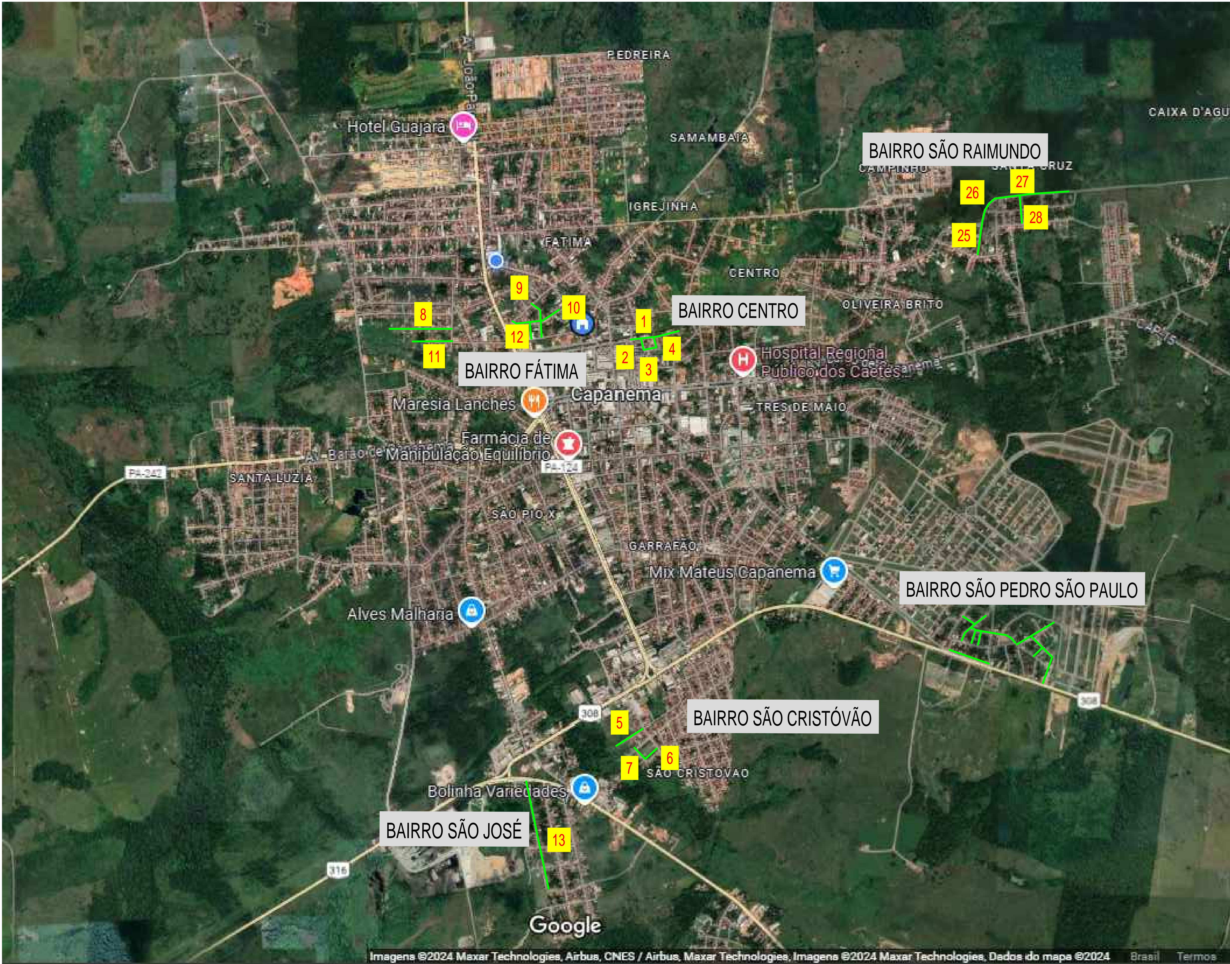
MAPA GERAL DO MUNICIPIO SEM ESCALA