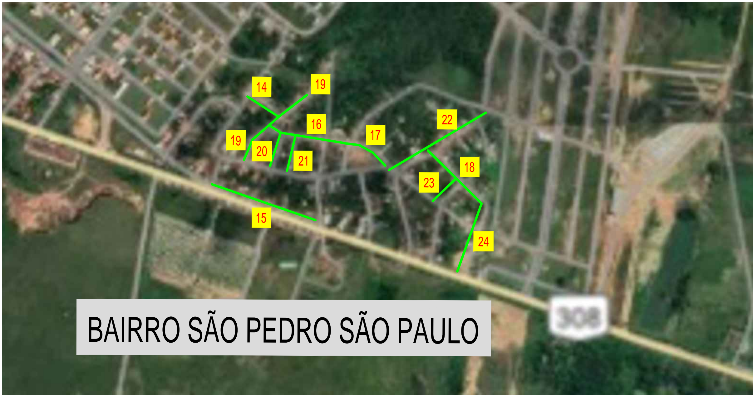
DETALHE DO BAIRRO SÃO PEDRO SÃO PAULO SEM ESCALA